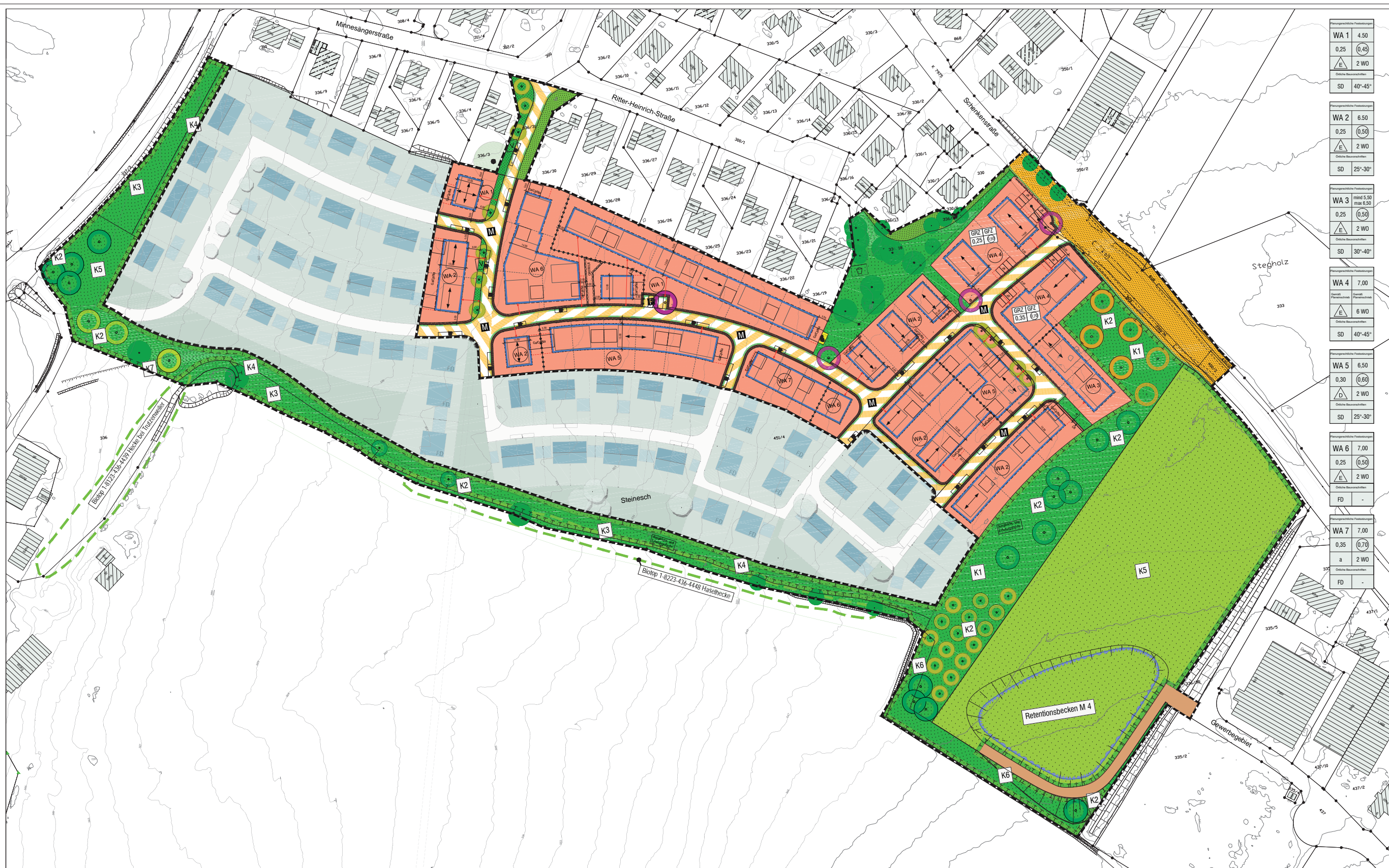
Lageplan der externen Kompensationsmaßnahme K8