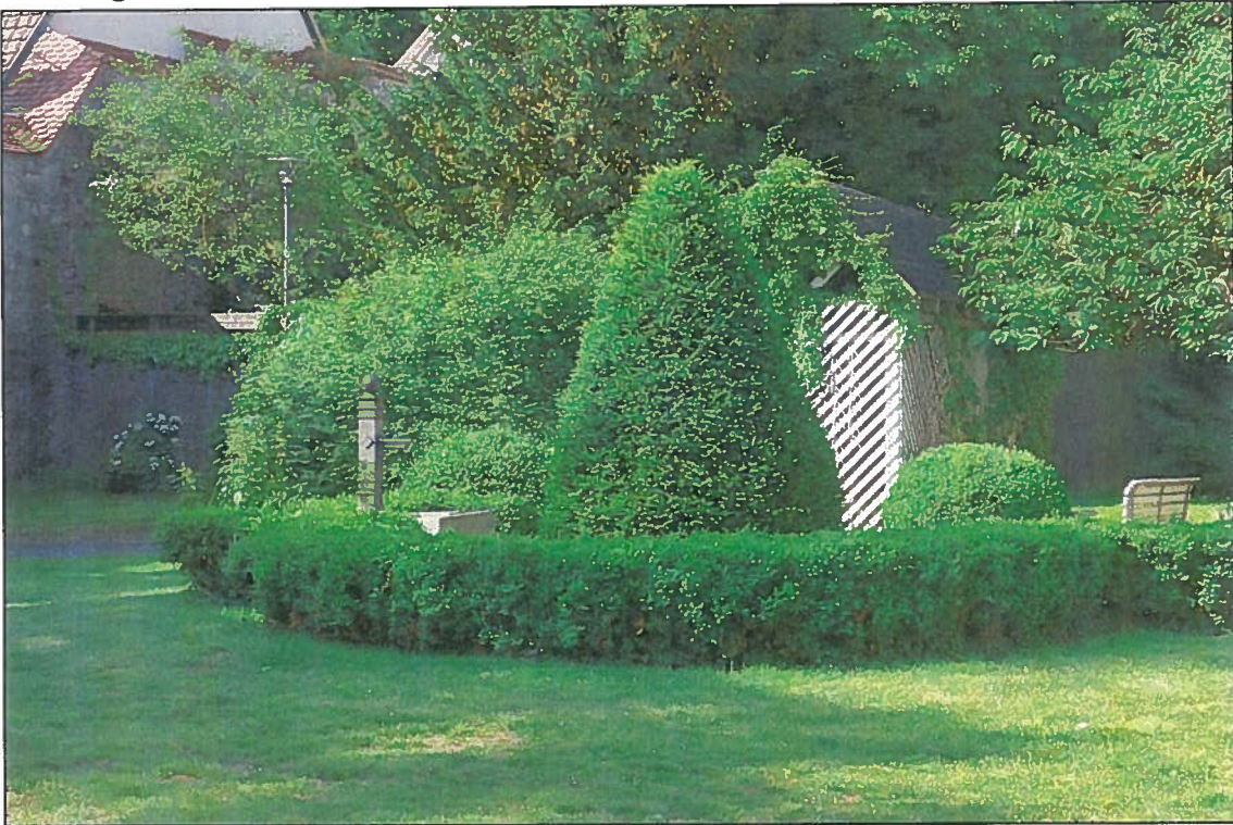
Abbildung 3: Das Zentrum des Varaždin-Gartens, Ansicht von Westen.