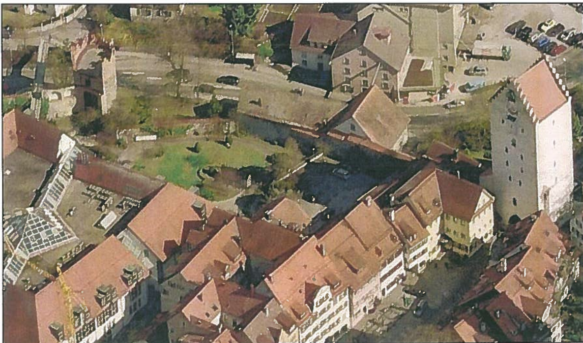
Abbildung 1 Blick auf den Varaždiner-Garten etwa von Westen.

Im Auftrag der Stadt Ravensburg wurde die Fläche deshalb zwischen April und Juli 2014 insgesamt fünfmal begangen und naturschutzfachlich und artenschutzrechtlich beurteilt.