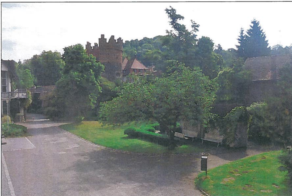
Abbildung 4: Blick über die Fläche von Südwesten.