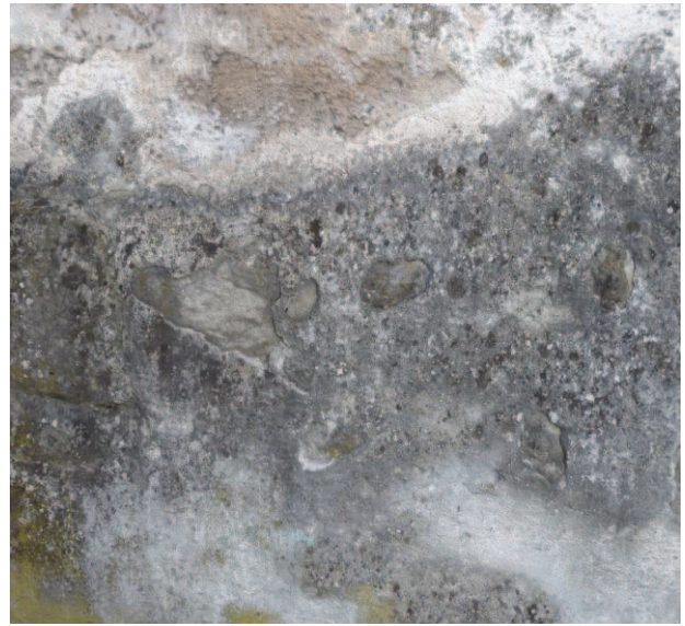
Putz aus früherer Sanierung