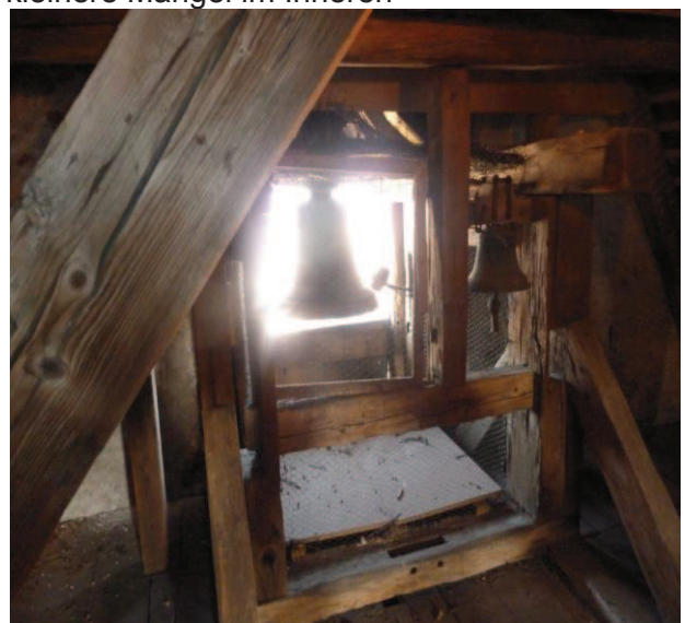
Dachstuhl mit Glocke