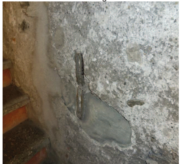
kleinere Mängel im Inneren