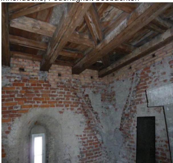
Bereich der Aufstockung