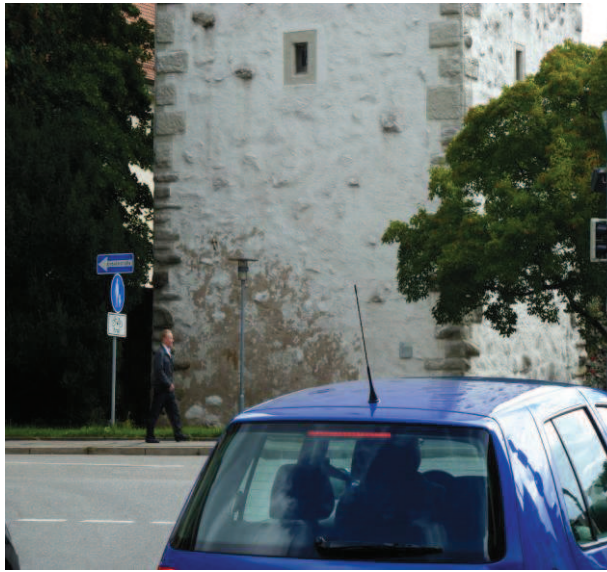
Sockel, Anstrich erneuern