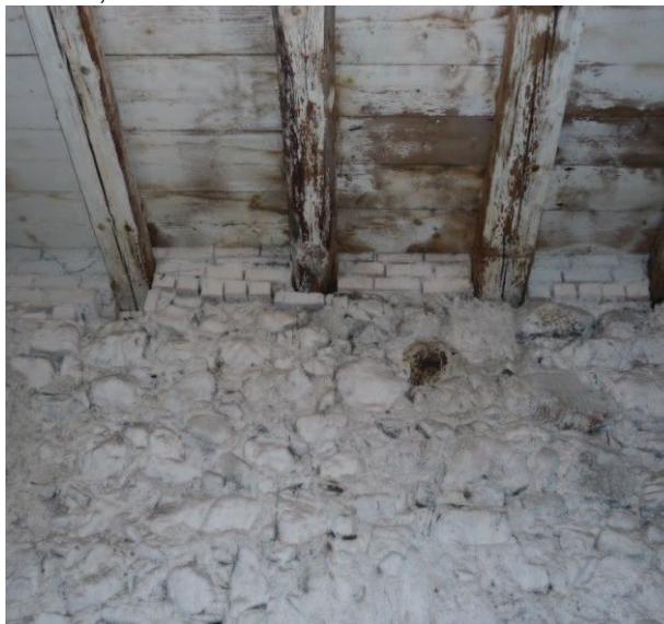
Innendecke, Feuchtigkeit beobachten