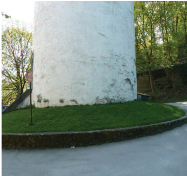
Sockel, abgewitterter Putz