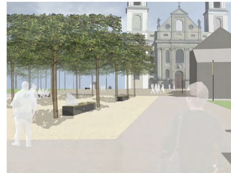
Visualisierung Rast- und Spielhain 2