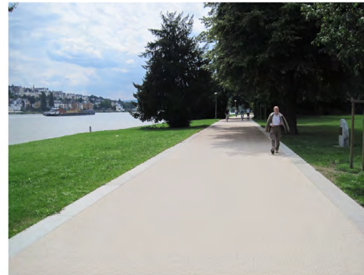
Beispiel Veredelter Asphalt