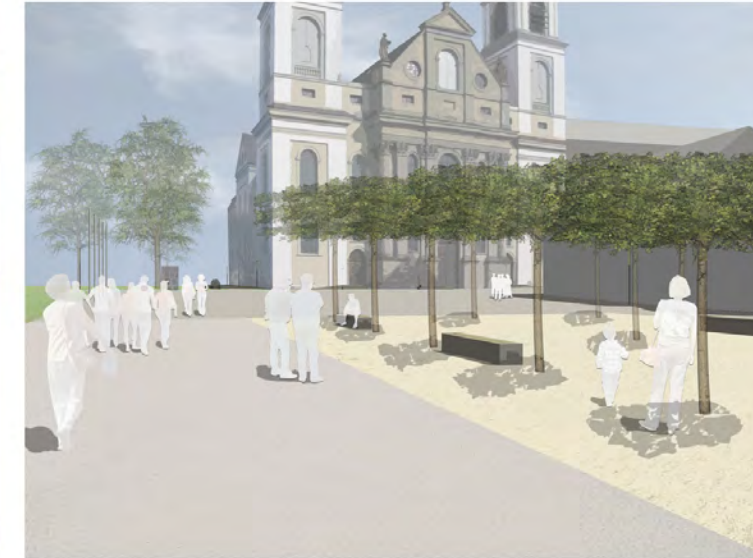
Visualisierung Rast- und Spielhain 1