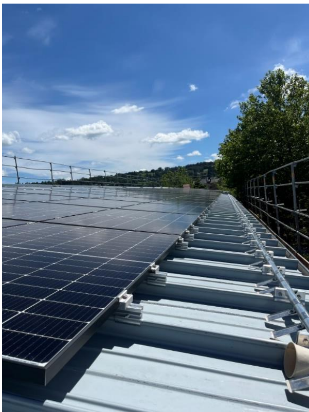
Neues Kalzip Dach mit PV- Anlage, 56 kWp