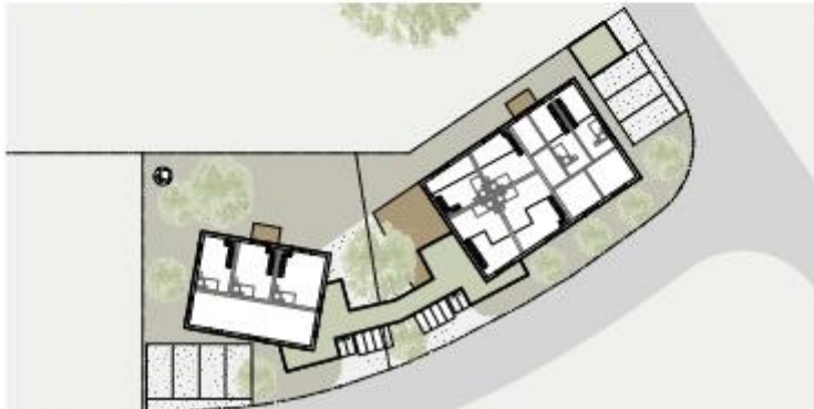
Galeriebene M 1:200