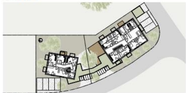
Obergeschoss M 1:200