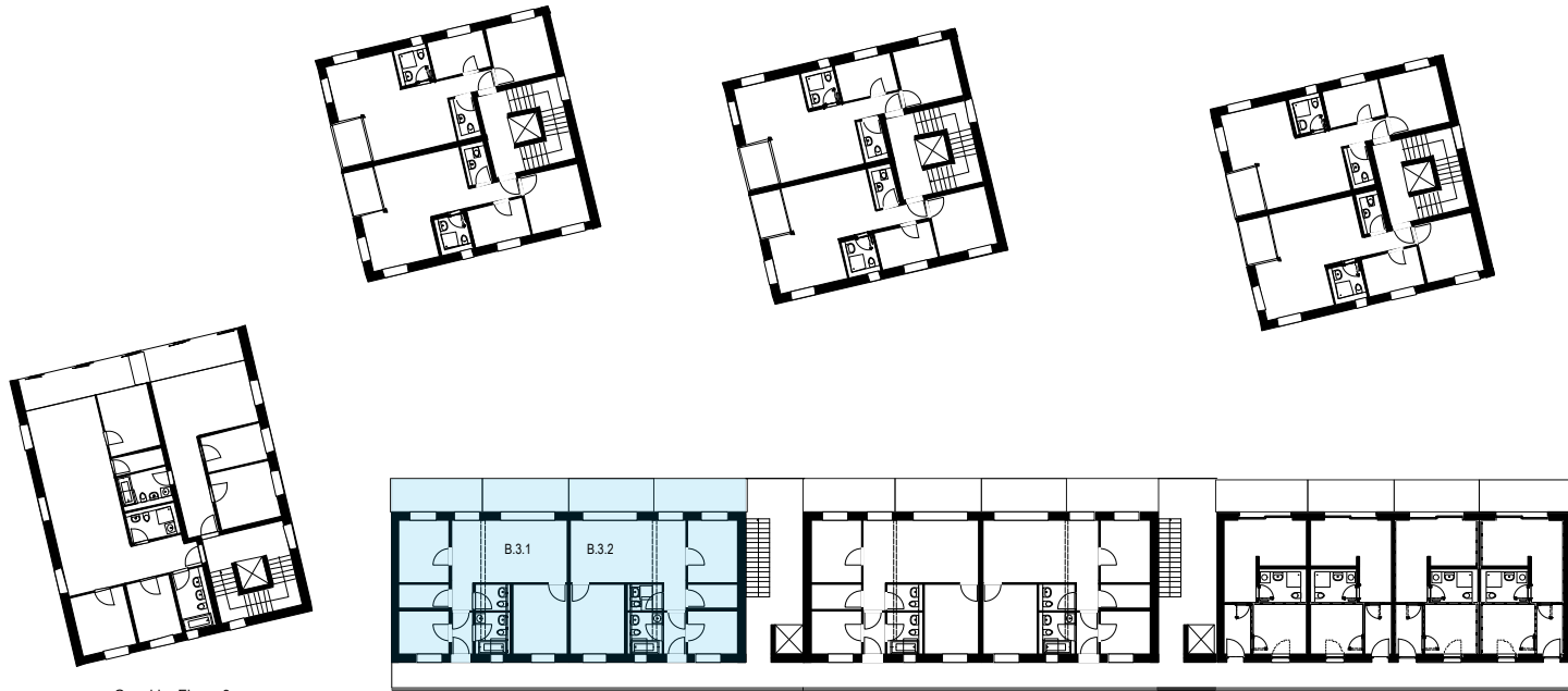
Grundriss Ebene 3