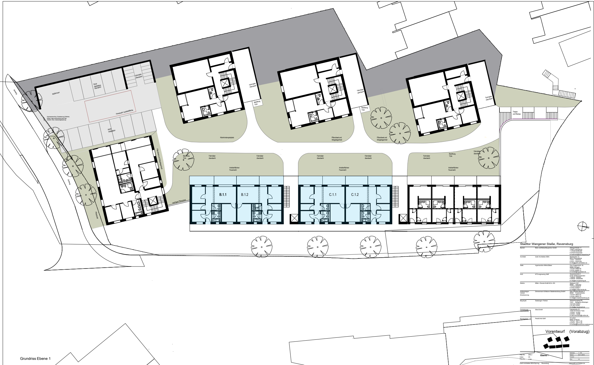
Grundriss Ebene 1