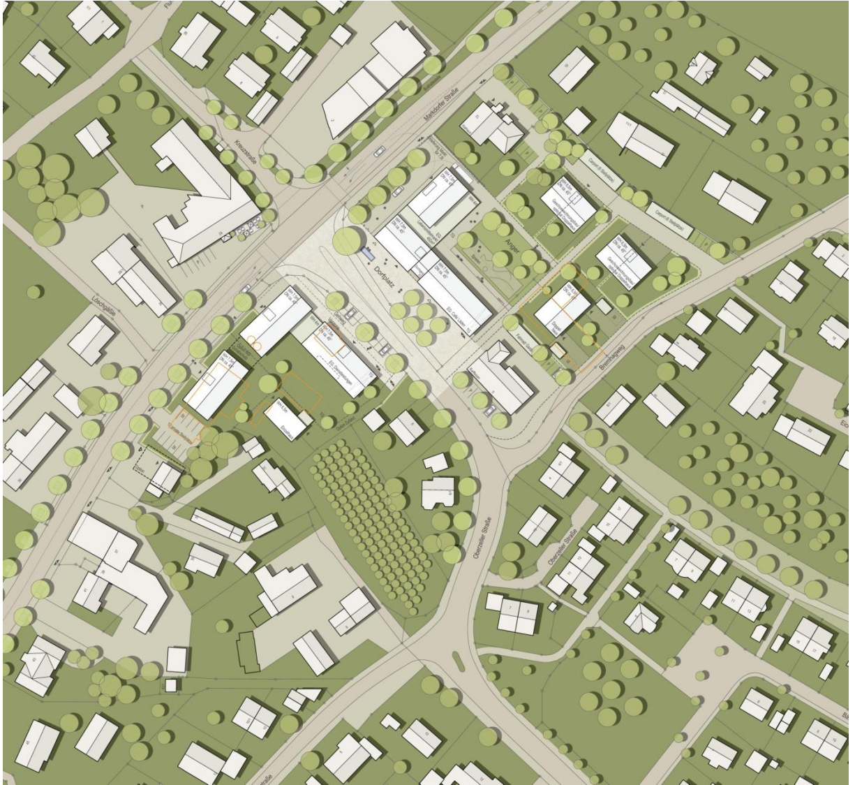
Abb. 1 Städtebaulicher Rahmenplan (K9 Architekten / faktorgrün)

über die Oberzeller Straße hinweg soll als Leitbild zur Erhaltung und Aufwertung der Ortsmitte weiterhin langfristiges Gestaltungsziel bleiben.