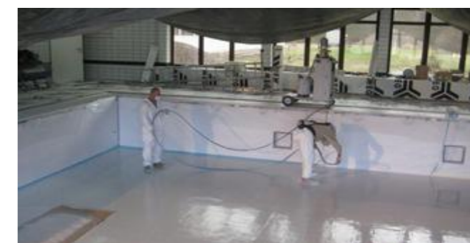
z.B. Fa. OWP - Odenwaldpool - www.odenwald-pool.de

Aufgestellt, Uhldingen- Mühlhofen 2017|07|18