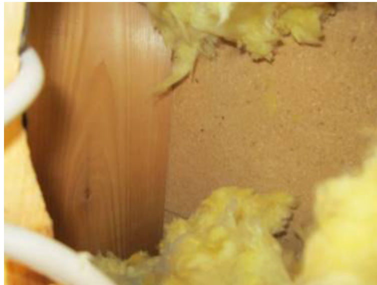
Bild 14: Öffnung 8