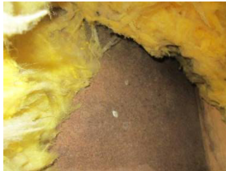
Bild 10 Öffnung 7 (Mineralfaser Pilzspuren)