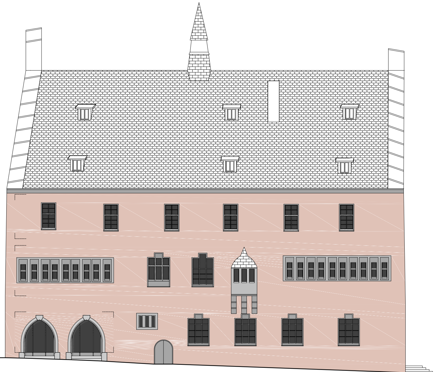
Ansicht Nord | 1:200

Datum | Index | Bearbeiter | Beschreibung ÄNDERUNGEN+ERGÄNZUNGEN