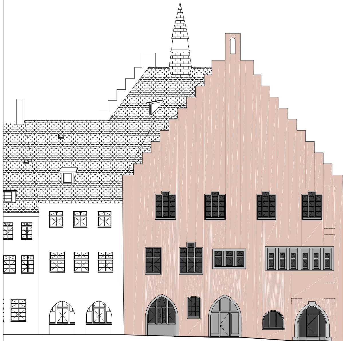
Ansicht Ost | 1:200